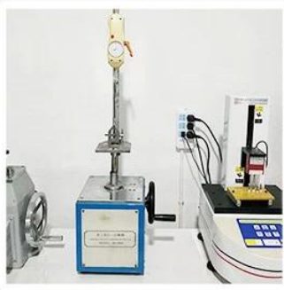
4. Bond Test