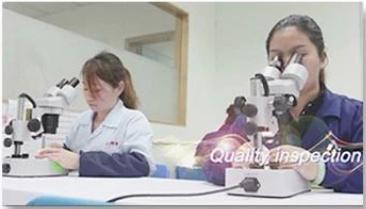
4. Quality inspection