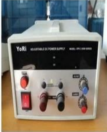
DC power supply