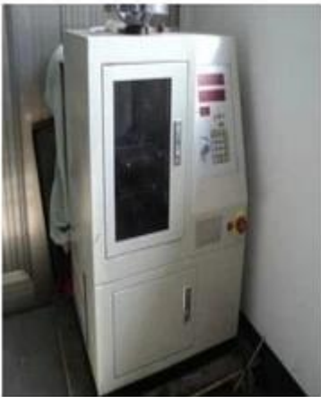
Spring exhausted tester