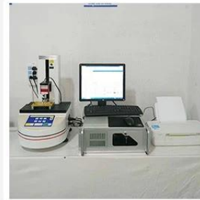
3. Load Curve Meter