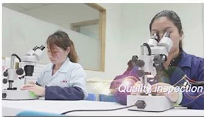
4. Quality inspection