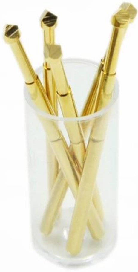
SF-P111 钻头 钻头 钻头 钻头