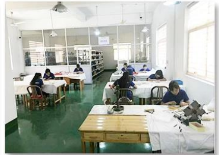
3. Assemble workshop