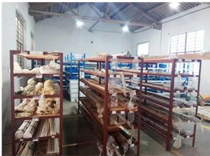
1. Raw material warehouse