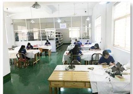
3. Assemble workshop