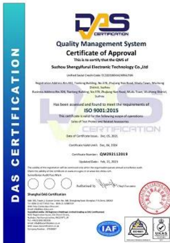
2023 ISO Certificate