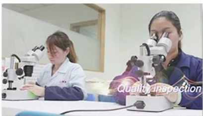
4. Quality inspection