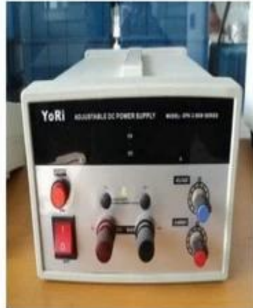
DC power supply