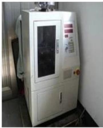
Spring exhausted tester