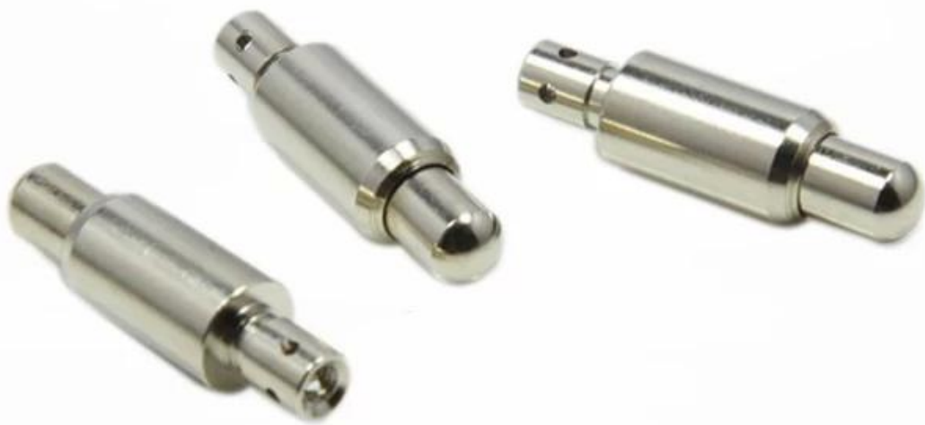
Pogo pin tekening