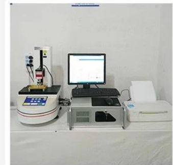
3. Load Curve Meter