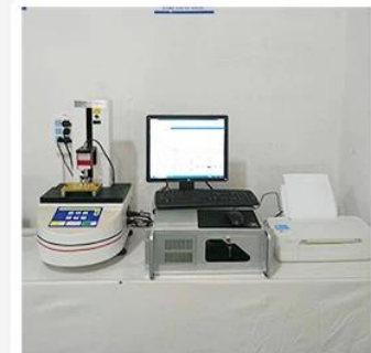
3. Load Curve Meter