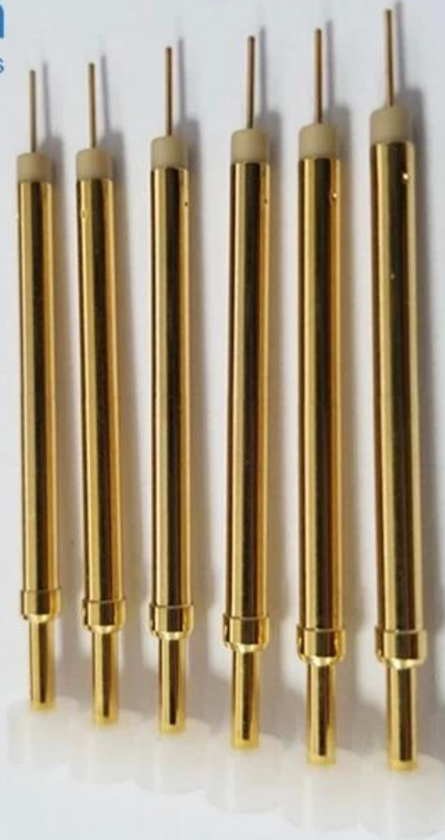
Schakelen test sonde tekening