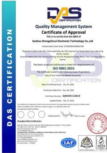
2023 ISO Certificate