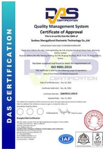
2023 ISO Certificate