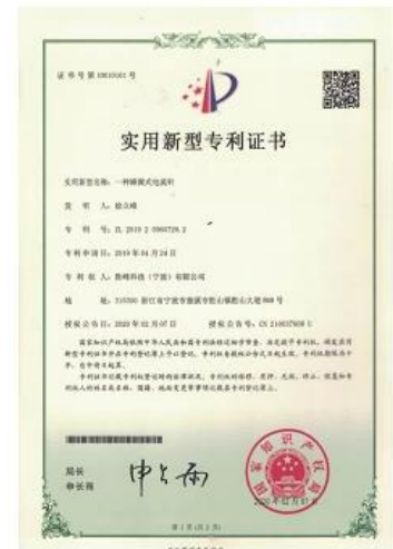
Patent for Honeycomb current probe