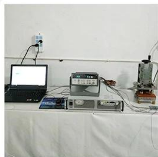
1. Agilent current testing