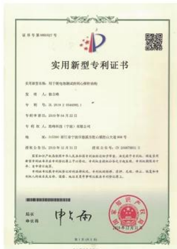
Patent for Coaxial Structure