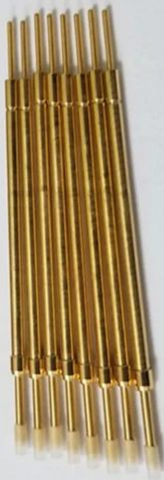
Desenho da sonda de teste de comutação