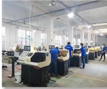
2. Lathe workshop