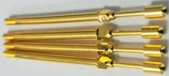
Desenho do pino da sonda personalizado