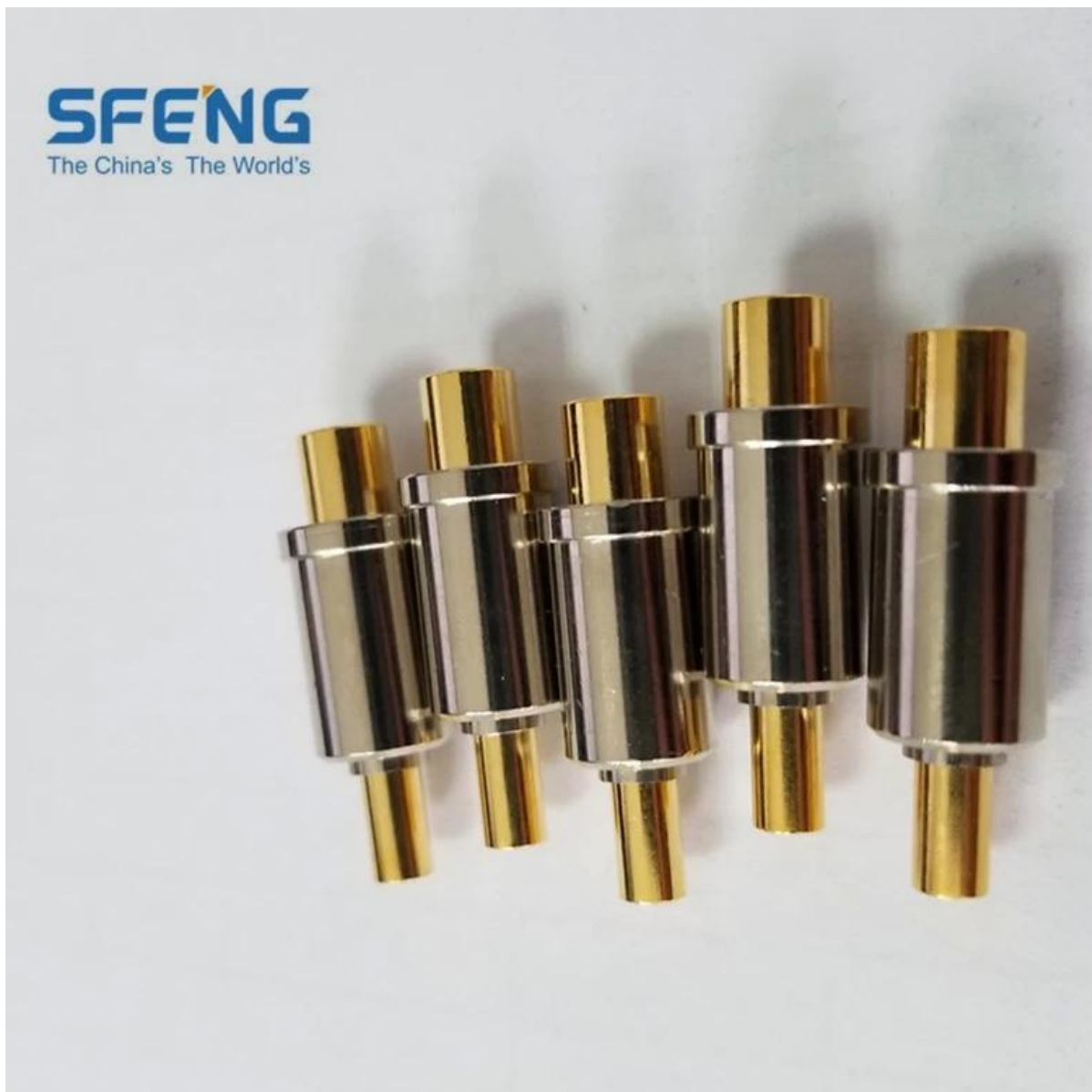
Imagem do produto