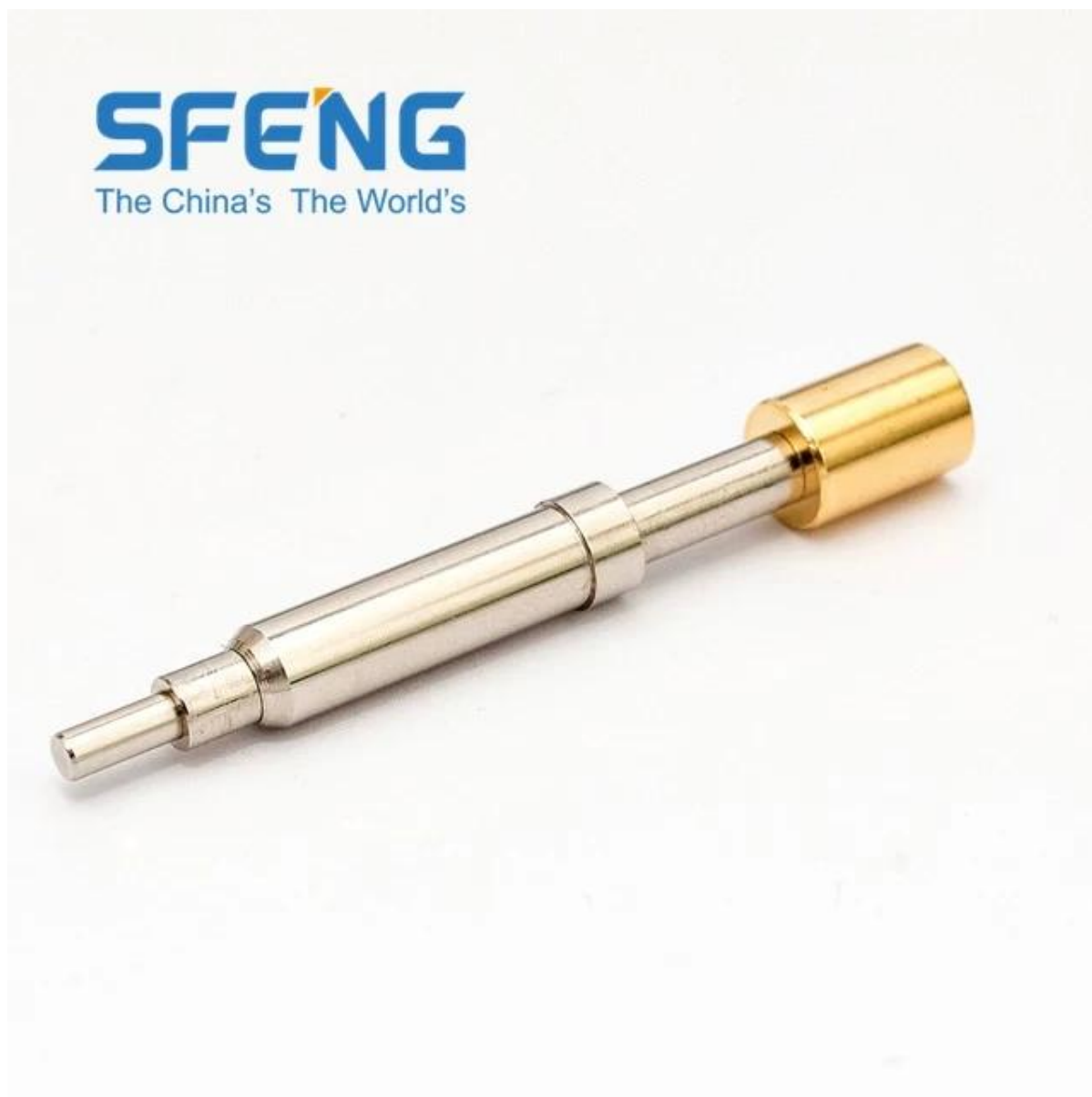
Imagem do produto