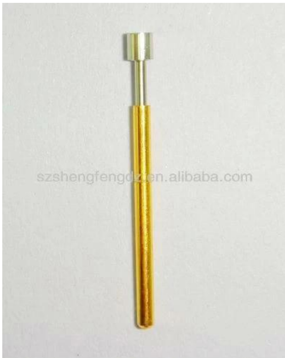
Imagem do produto