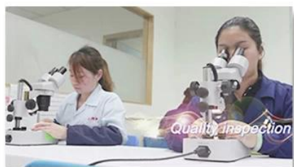
4. Quality inspection