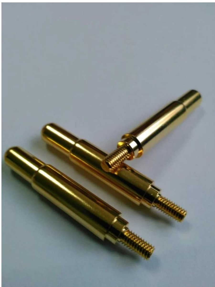
Imagem do produto