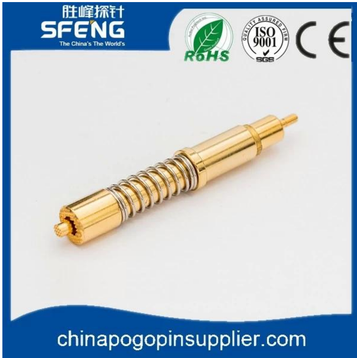
Imagem do produto