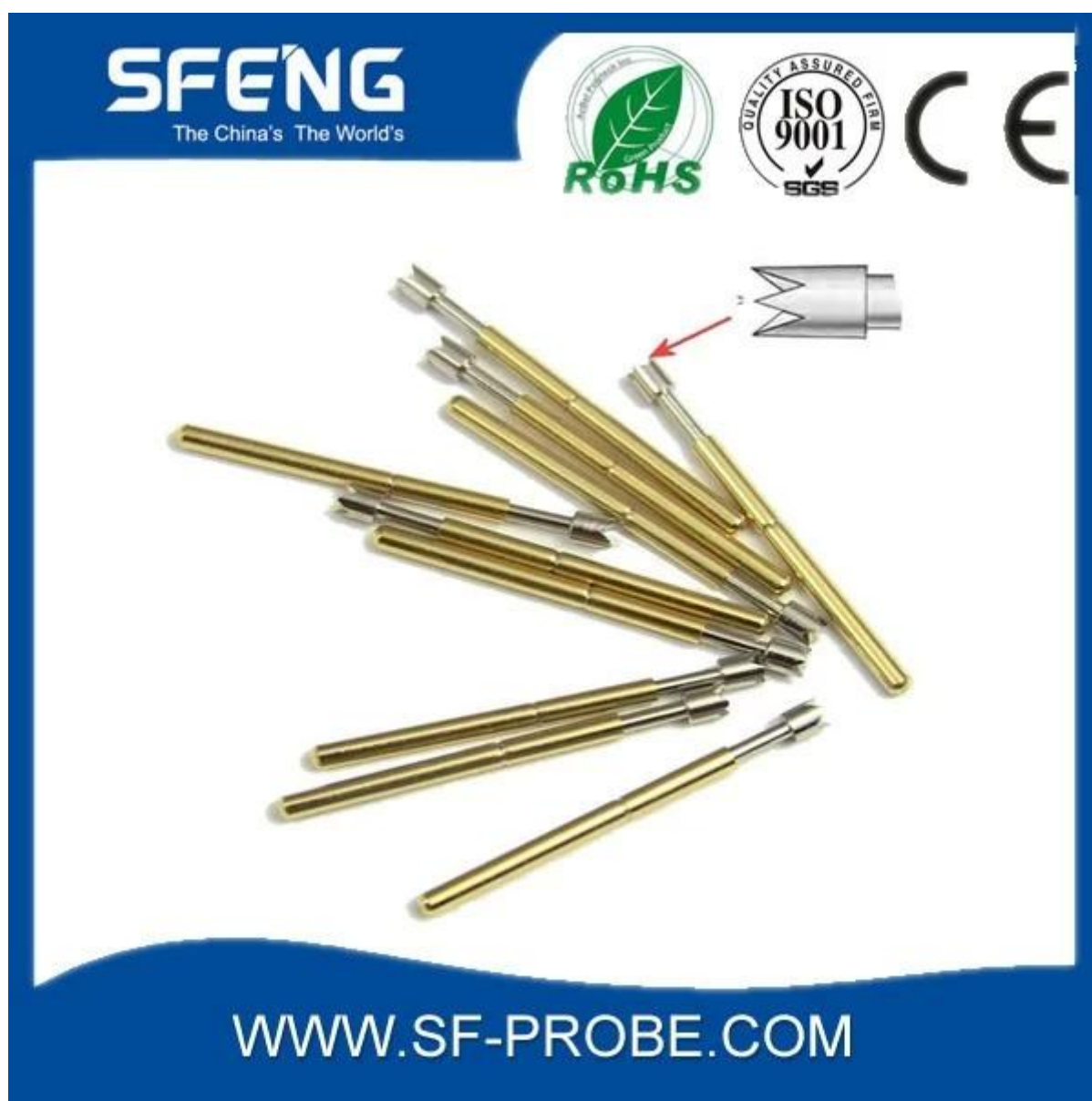
Imagem do produto