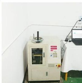
5. Life Fatigue Test