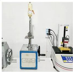
4. Bond Test