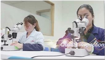
4. Quality inspection