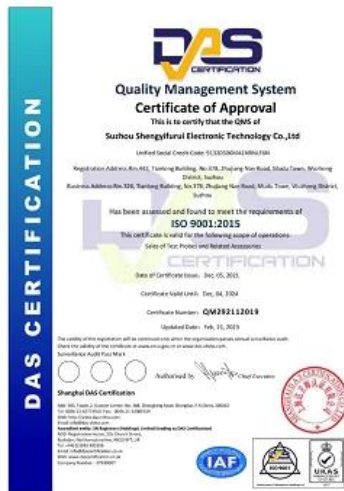
2023 ISO Certificate