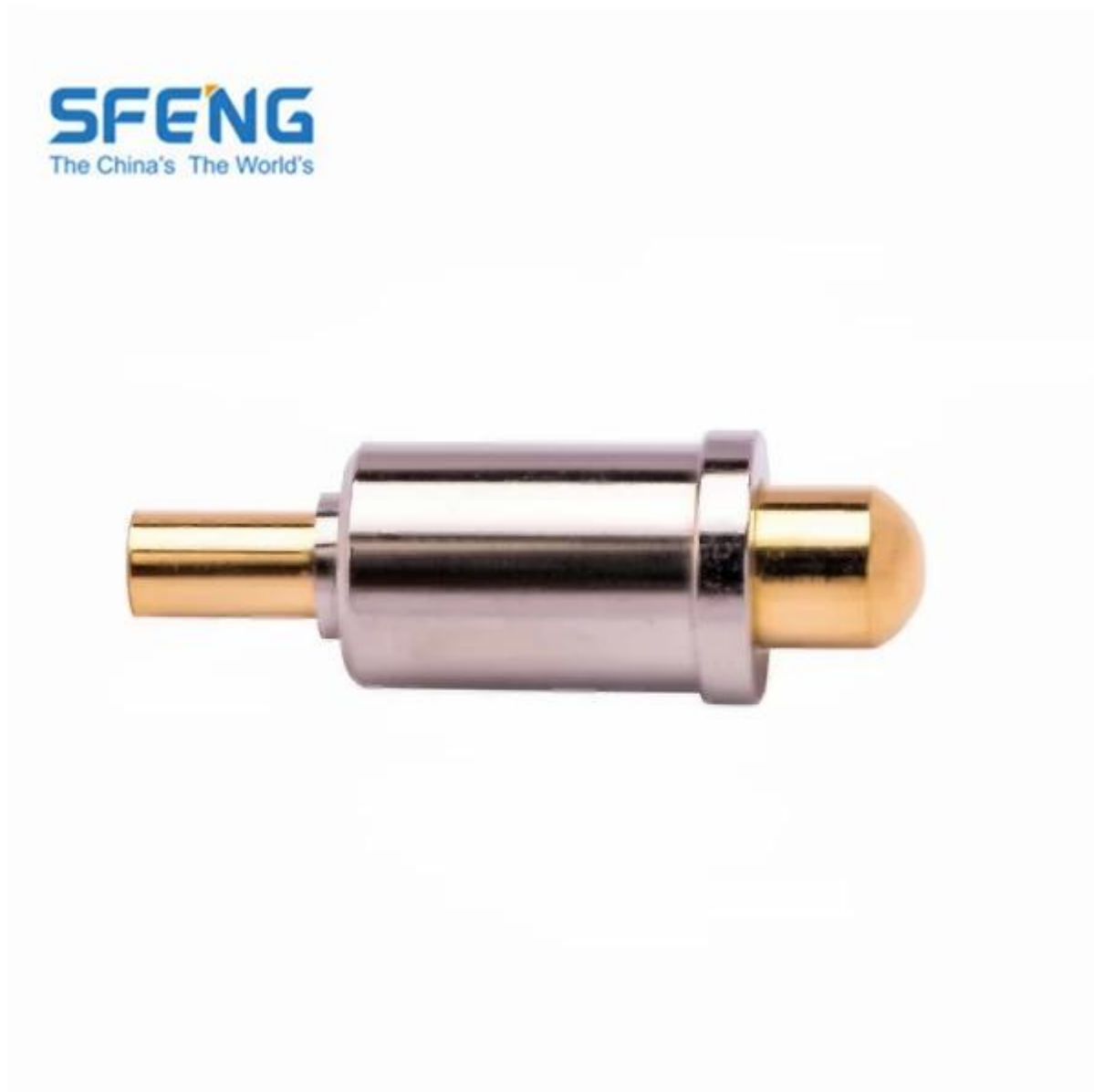
Imagem do produto