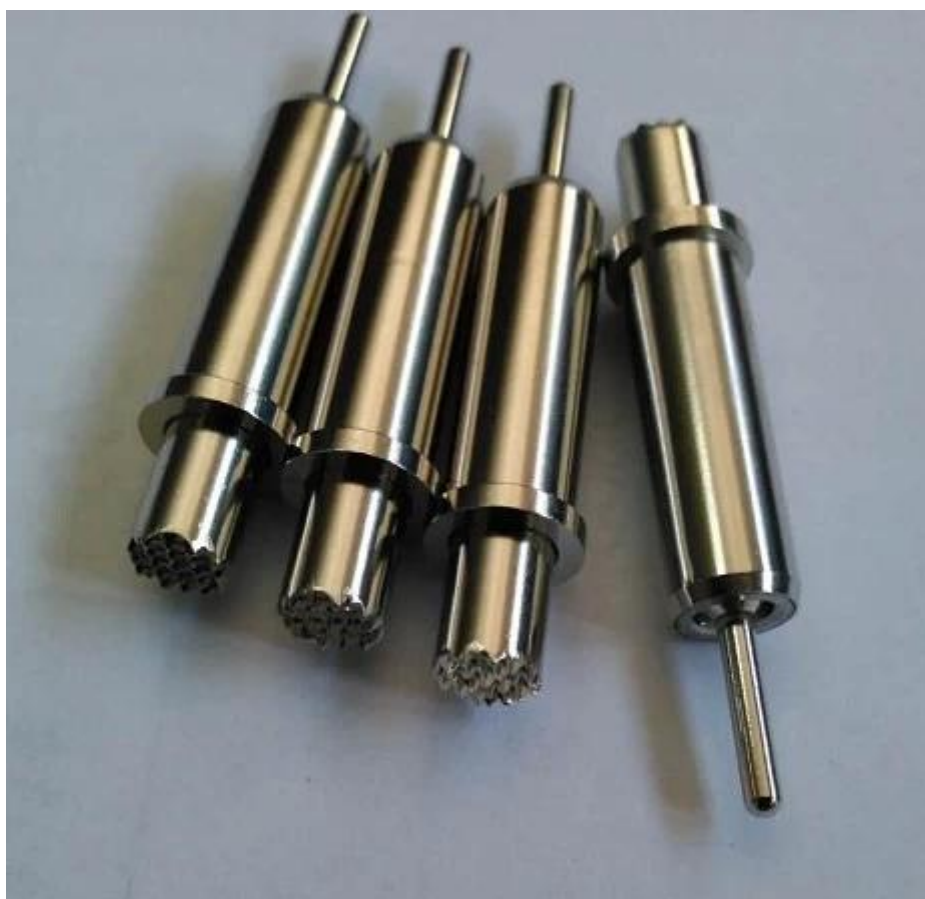
Imagem do produto