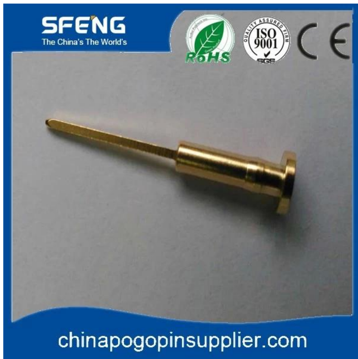
Imagem do produto