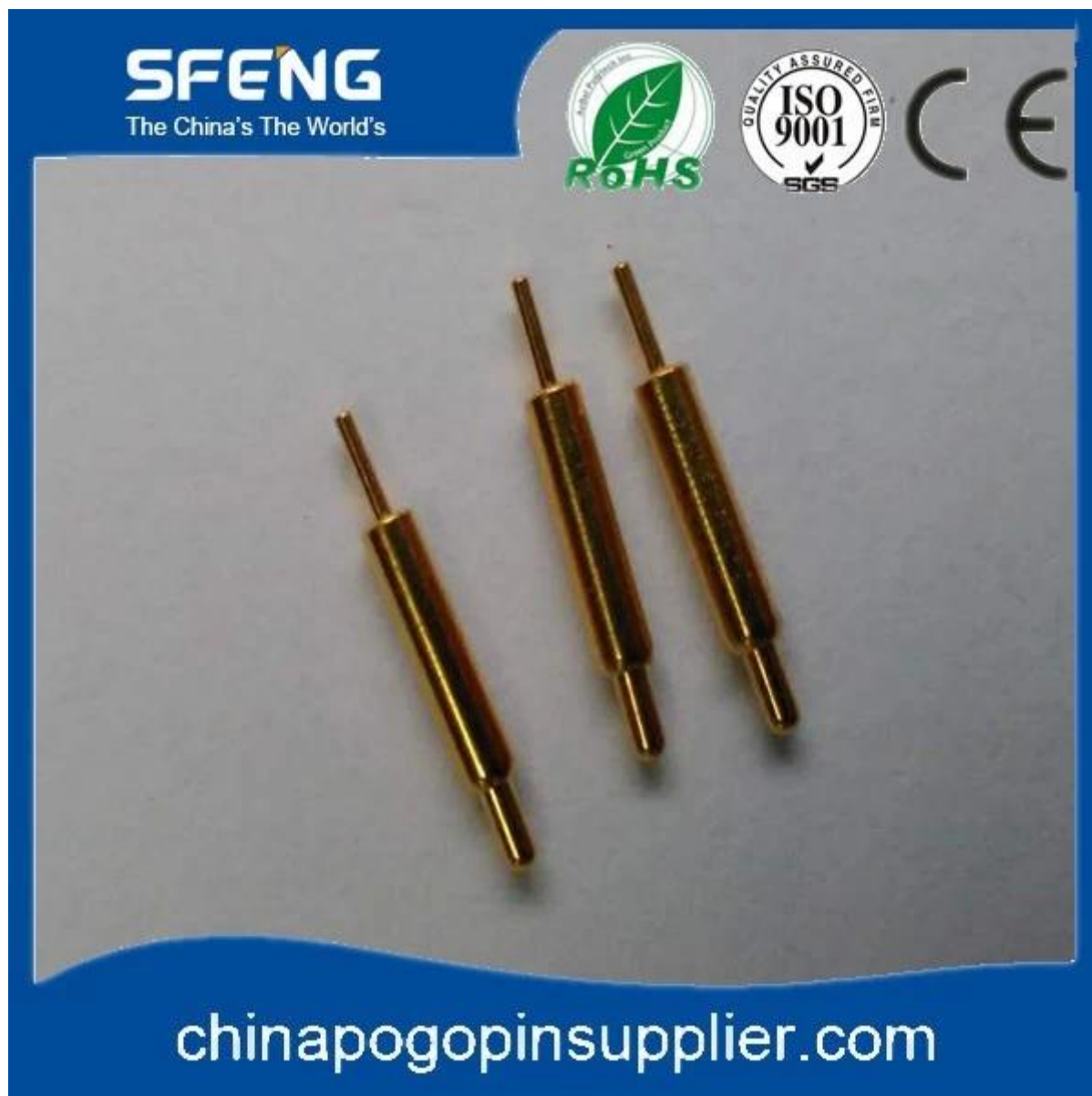
Imagem do produto