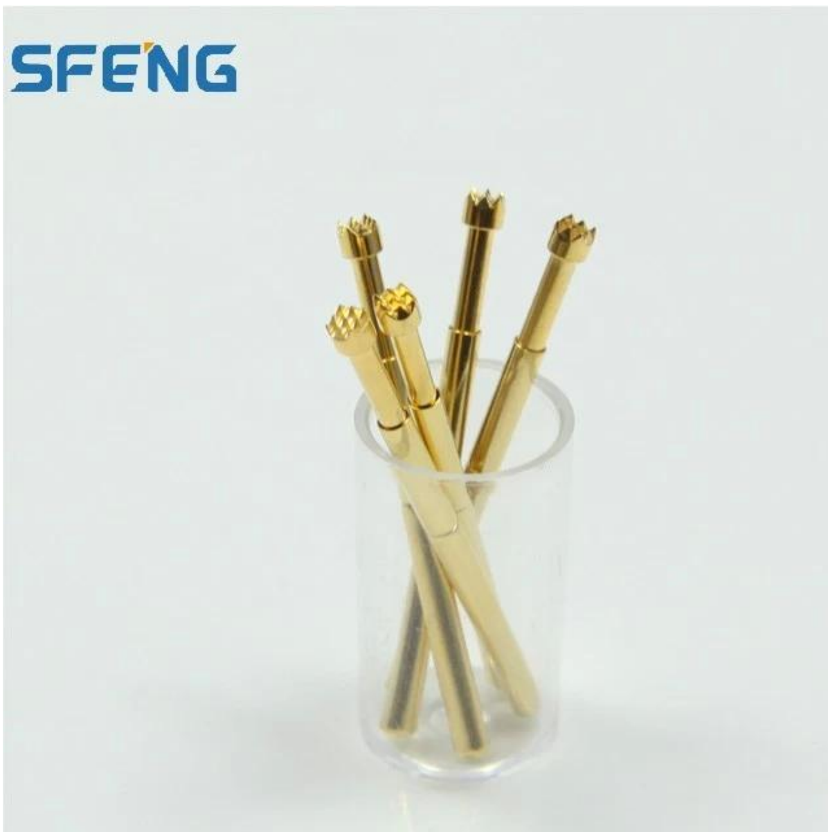
Imagem do produto