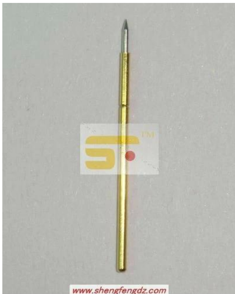
Imagem do produto