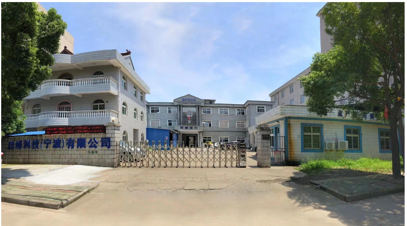
imagem de fábrica

Outros componentes eletrônicos relacionados, linha 30 # OK, trava gabarito, POM, dobradiças de ferro, etc.