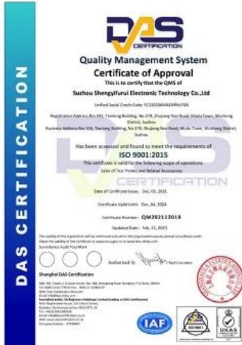
2023 ISO Certificate