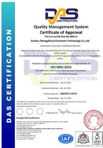
2023 ISO Certificate