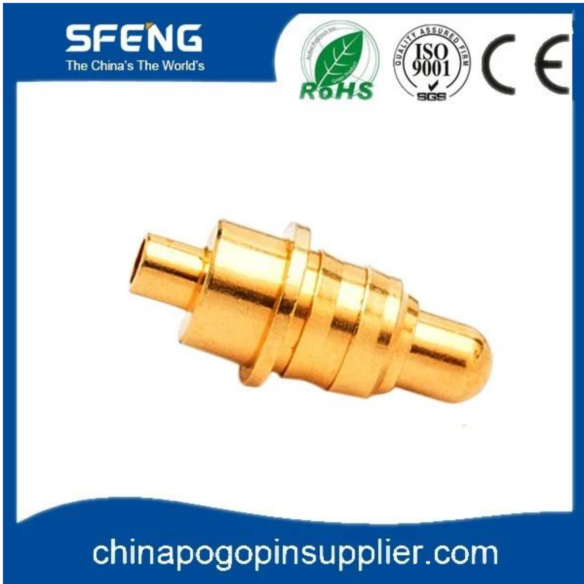
Imagem do produto