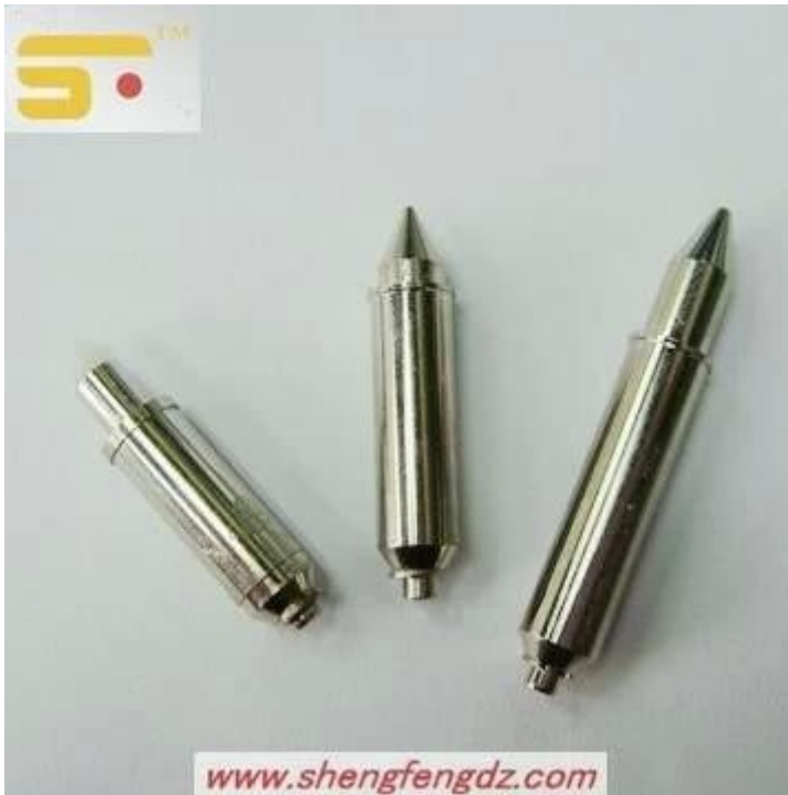
Imagem do produto