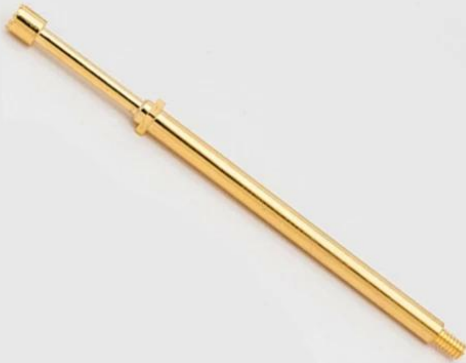
Desenho da sonda de teste de parafuso