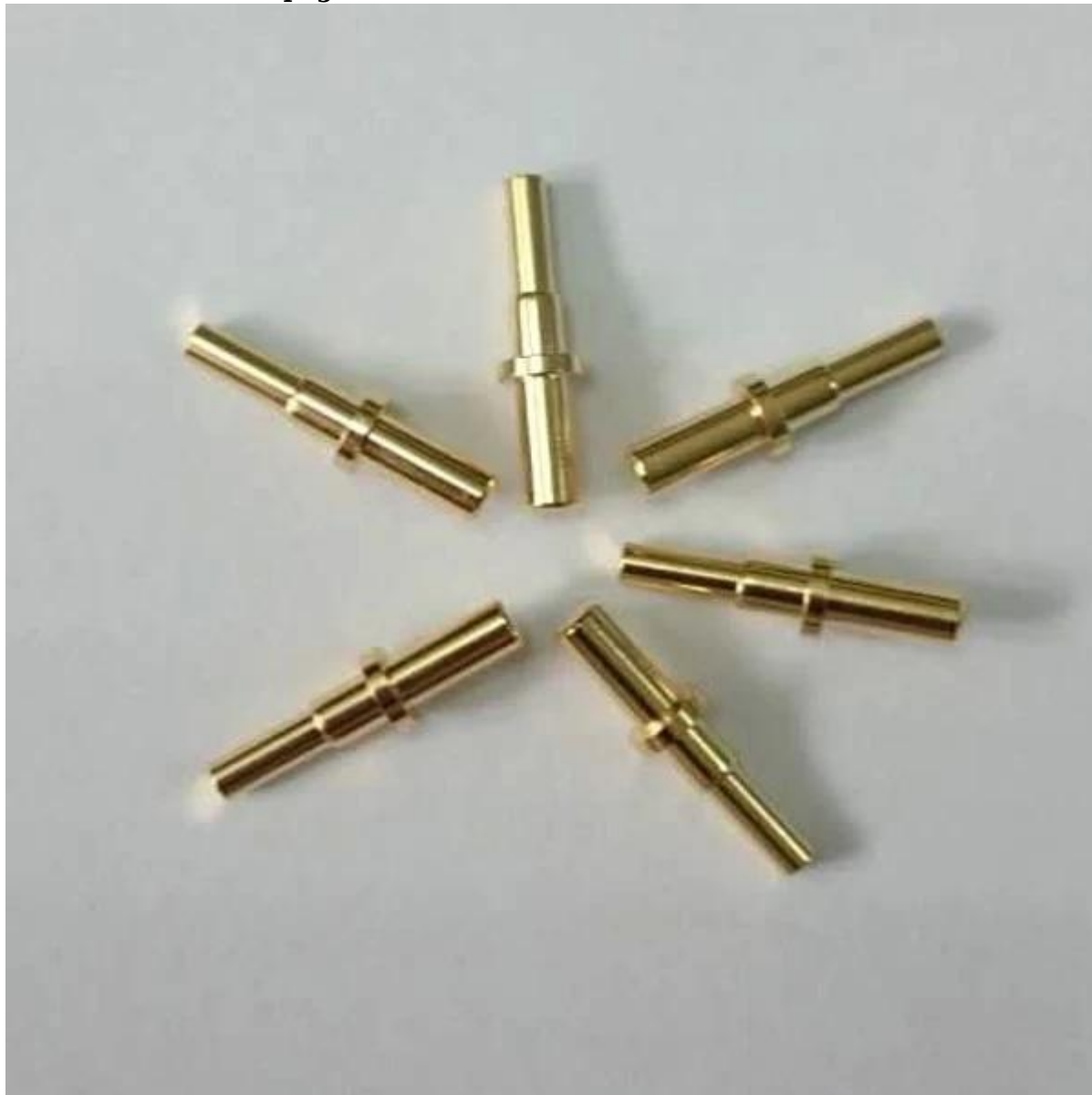
Foto do conector do pogo da bateria