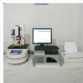
3. Load Curve Meter