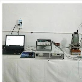
1. Agilent current testing