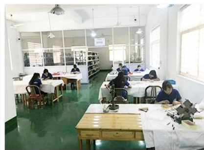
3. Assemble workshop