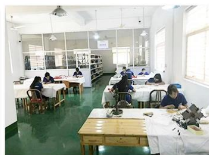
3. Assemble workshop