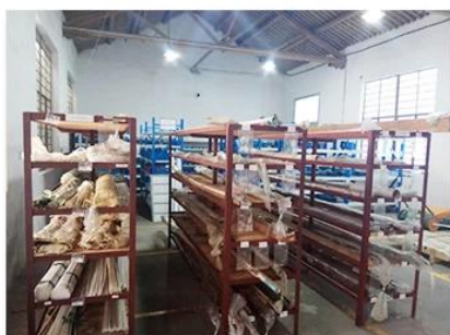
1. Raw material warehouse