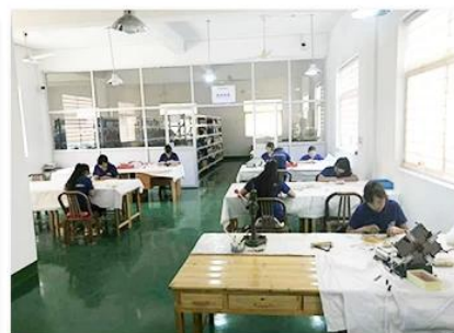
3. Assemble workshop