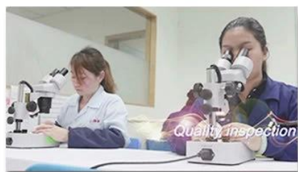
4. Quality inspection