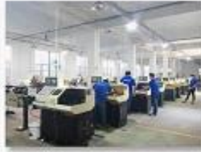
2. Lathe workshop