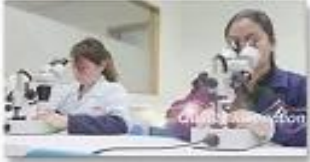
4. Quality inspection