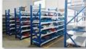
5. Finished products