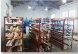
1. raw material warehouse