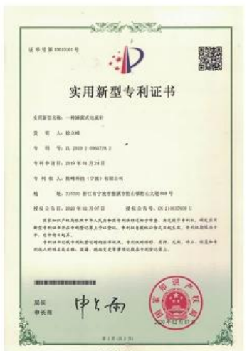
Patent for Honeycomb current probe