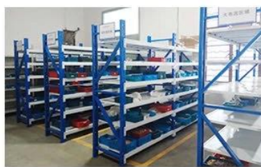
5. Finished products