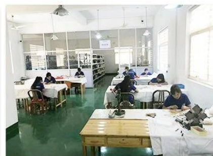
3. Assemble workshop