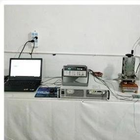
1. Agilent current testing